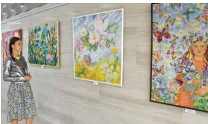
Выставка работ в технике «батик»

На выставке представлены работы, выполненные в технике «батик». Под этим названием подразумевается ручная роспись по ткани, например, шёлку, с применением резервирующих составов. Приглашаем ознакомиться с необычными картинами, насладиться великолепными узорами и сочетаниями нежных цветов!