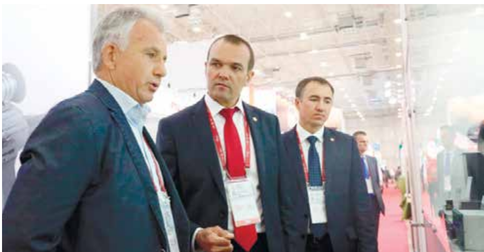
С Главой Чувашской Республики М.В. Игнатьевым (в центре)

С 21 по 26 августа в КВЦ «Патриот» г. Кубинки (Московская область) проходил IV Международный военно-технический форум «Армия-2018». Одним из участников масштабного смотра стало АО «ЭЛАРА», вносящее свой вклад в укрепление обороноспособности страны.